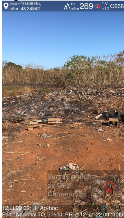
Figura 1- Panorama do Lixão

12jul.22 09:11 Ad-hoc Porto Nacional TO, 77500, BR © 12-jul.-22 09:11:49