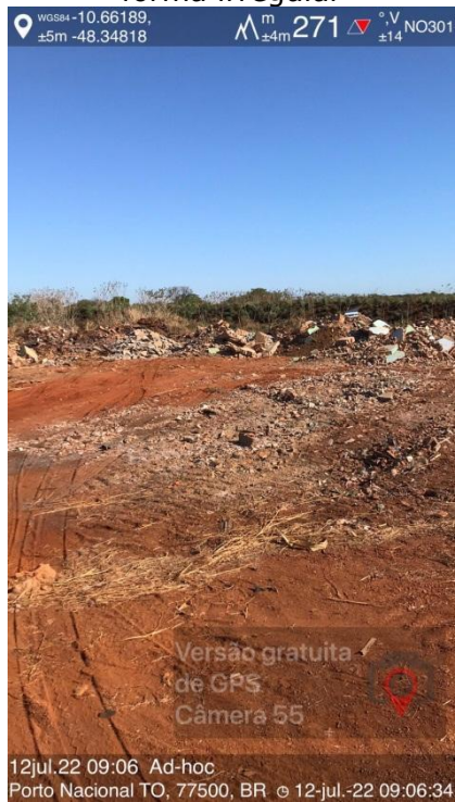
Figura 3- Resíduos descartados de forma irregular

12jul.22 09:06 Ad-hoc Porto Nacional TO, 77500, BR © 12-jul.-22 09:06:34