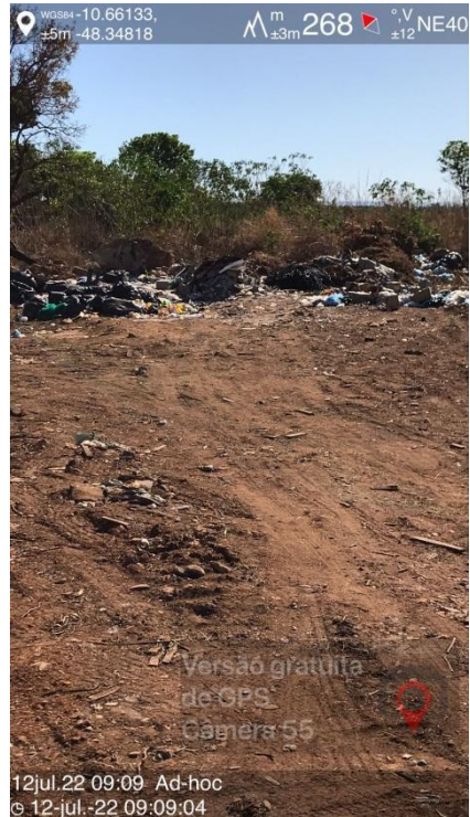
Figura 2- Resíduos descartados de forma incorreta

12jul.22 09:09 Ad-hoc © 12-jul.-22 09:09:04